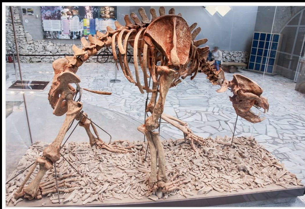
Ryc. 7. Rekonstrukcja szkieletu niedźwiedzia jaskiniowego w pawilonie wystawowym przy wejściu do jaskini Niedźwiedziej w Kletnie (Masyw Snieżnika), ISO 100, f/20, 3 sek.