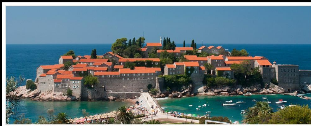
Ryc. 5. Wyspa Św. Stefana (Czarnogóra), ISO 320, f/18, 1/40 sek.