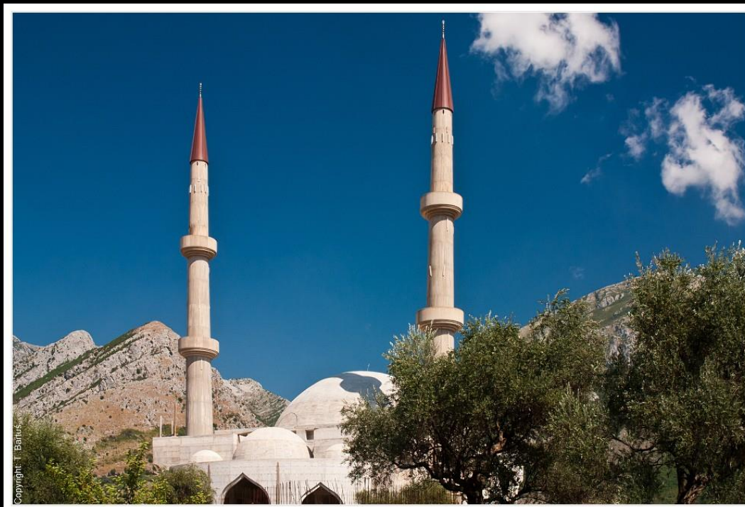
Ryc. 6. Meczet w Stari Bar (Czarnogóra), ISO 320, f/14, 1/50 sek.