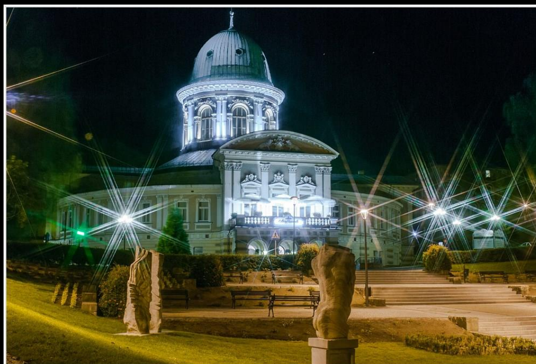
Ryc. 1. Zakład przyrodolecznicy „Wojciech” w Łądku-Zdroju, ISO 100, f/14, 28 sek. A – RAW (przed obróbką), B – JPG (po obróbce).