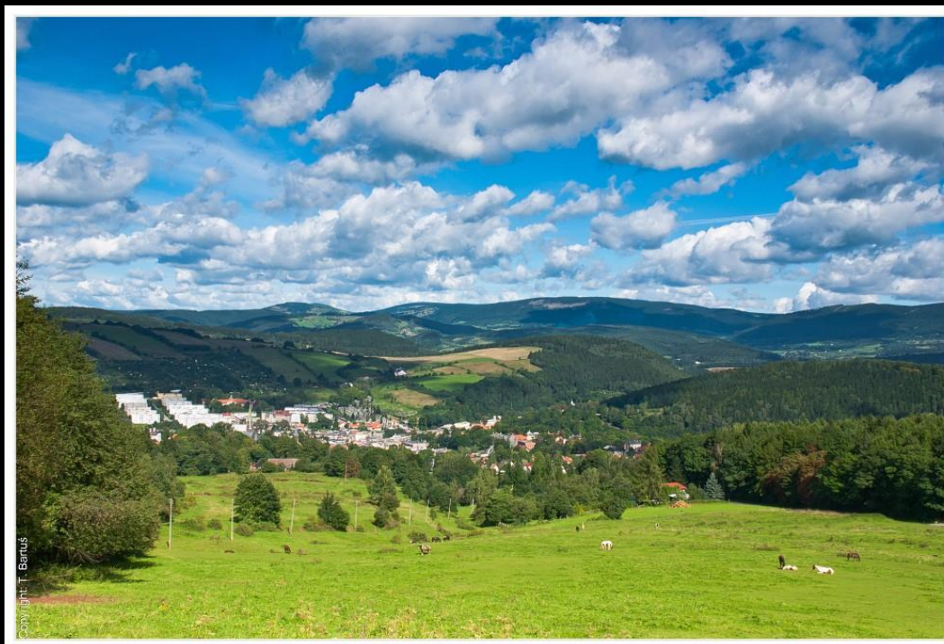
Ryc. 2. Widok z Góry Św. Anny w kierunku północnym. W tle Góry Sowie, w dolinie Nowa Ruda, ISO 100, f/22, 1/4 sek., fot.: T. Bartuś