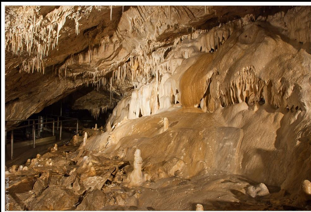
Ryc. 4. Jaskinia Niedźwiedzia w Kletnie. ISO 100, f/13, 18 sek., fot.: T. Bartuś