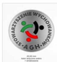
Znaczek SW AGH